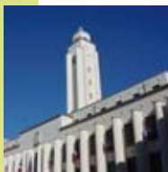
> Mairie de Villeurbanne