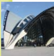
> Gare-aéroport Lyon Saint Exupéry