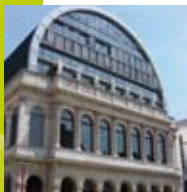
> Opéra de Lyon