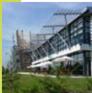
> Lyon parc technologique