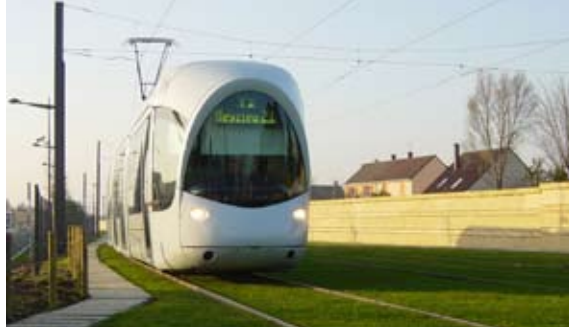
> Tramway Ligne 3