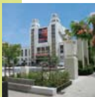
> Centre d'art dramatique Villeurbanne